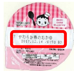
「やわらか鶏のおかゆ」 賞味期限 2017. 12. 14 の 表示があるものが当該品

お手数ではございますが、お手元に対象商品がございましたら、下記の方法で送付のお手続きをお願い申し上げます。後日、商品代金相当の「クオカード」を送付させていただきます。